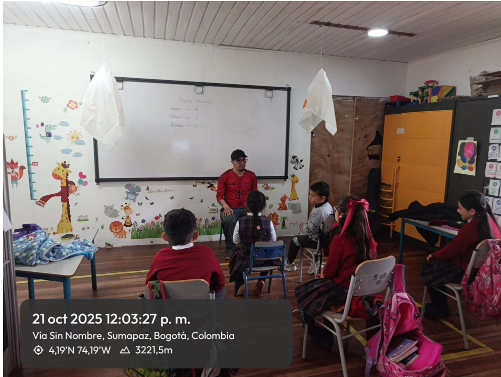
Sede Santa Rosa