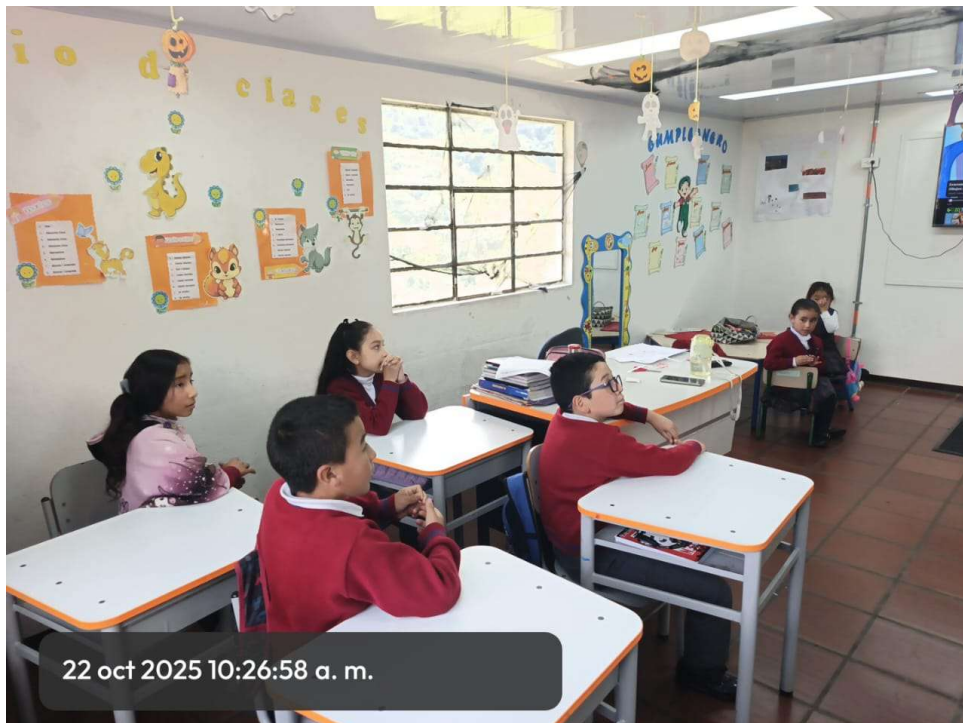
Sede Los Ríos